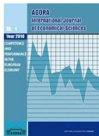
Revistă inclusă în BDI (categoria CNCS B+) BDI: Copernicus, SOCOLA@R