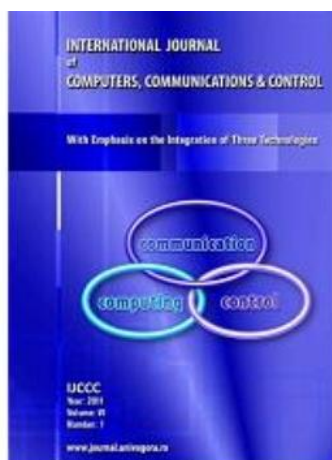
IJCCC: Revistă cotate ISI (categoria CNCS A) Factor de impact 0,650